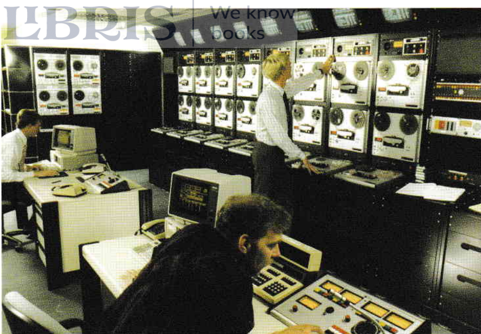
6. Master Control — Centrul de emisie.