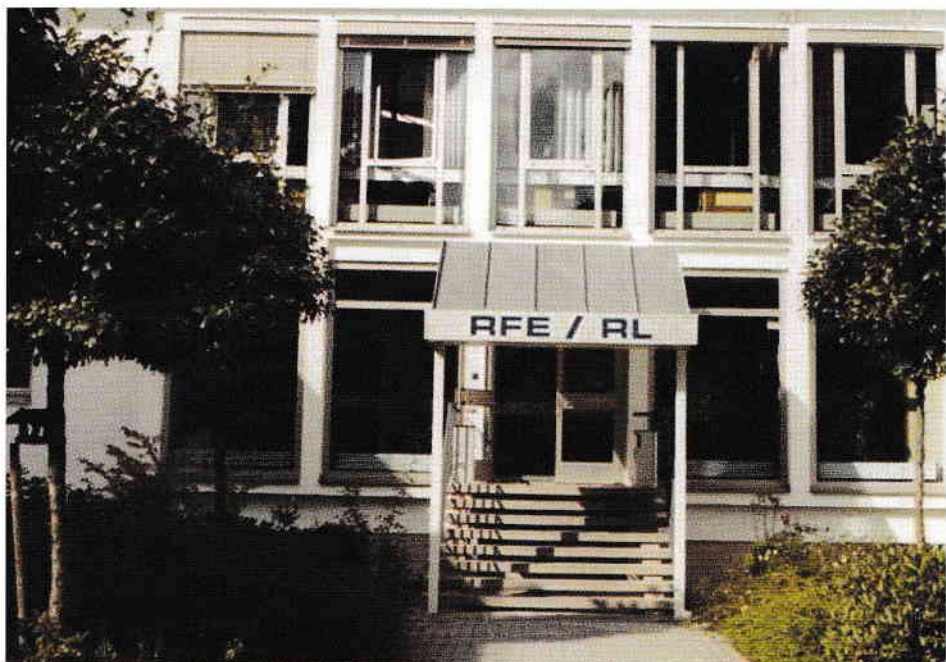
5. Intrarea în radio.